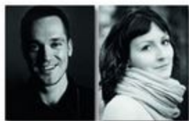
Руководитель проекта: Владимир Митин Автор проекта: дизайнер Евгения Смирнова

В интерьере за основу взят белый цвет, создающий впечатление воздушности и легкости. Панели из натурального оникса притягивают взоры и оживляют монохромное пространство.